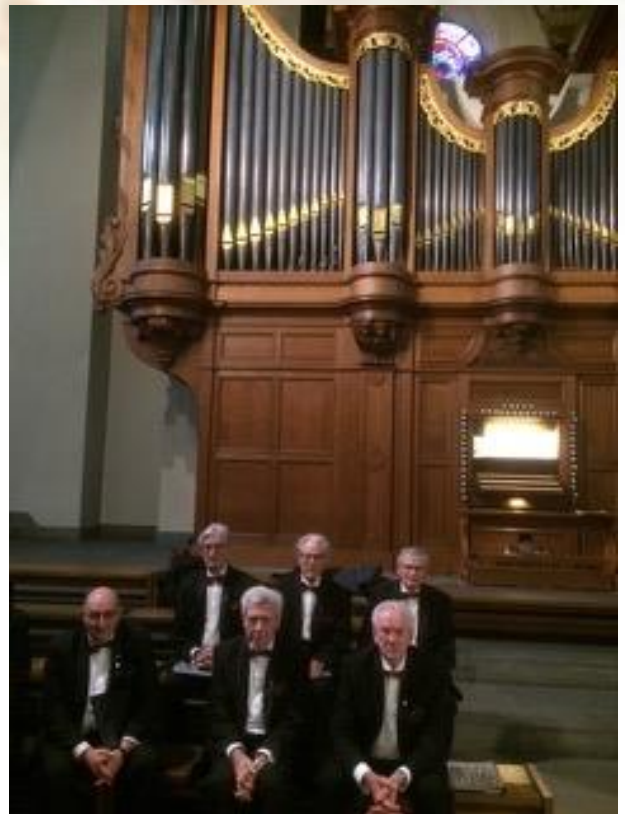
Uitvaartdienst in de Sint Servaas Basiliek