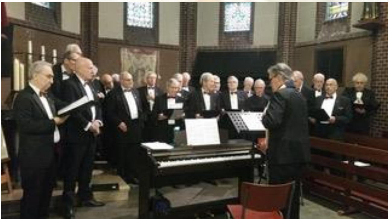
Uitvaartdienst in de Sint Corneliuskerk te Borgharen