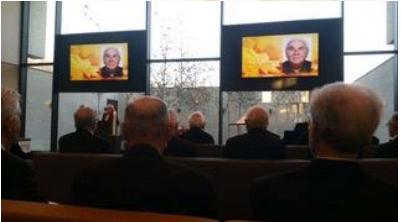
Dienst in Crematorium la Grande Suisse