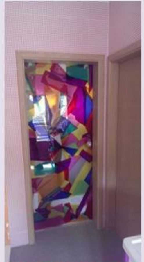
De wereld mooier maken met glas

Openingstijden: Werkdagen van 8.00 tot 18.00 uur