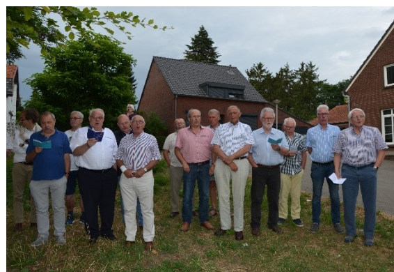
Uiteraard werd er ook gezongen bij de beukenboom