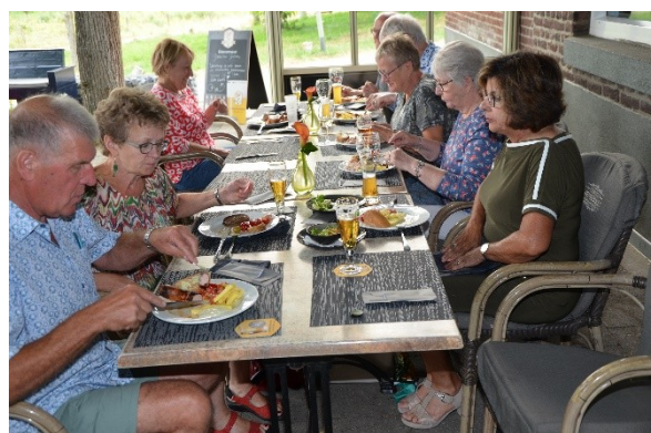
... en de glazen ook ...