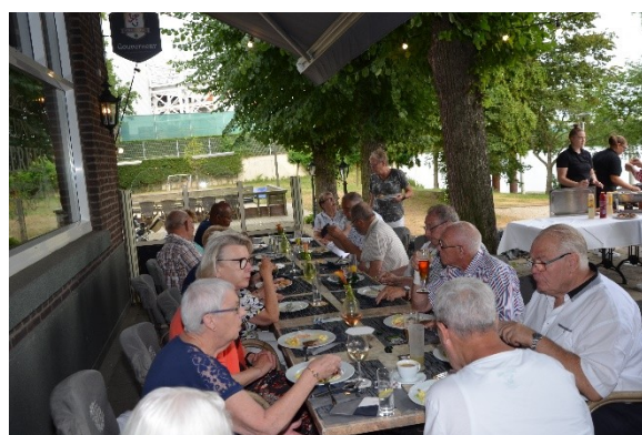
De bordjes waren goed gevuld