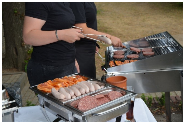
3 Soorten vlees op de barbecue

Op zaterdag 6 juli 2019 werd de traditionele afsluitende barbecue gehouden bij 'Gewoon Meneerkes'. Het weer was prima, evenals de sfeer en de barbecue zelf.